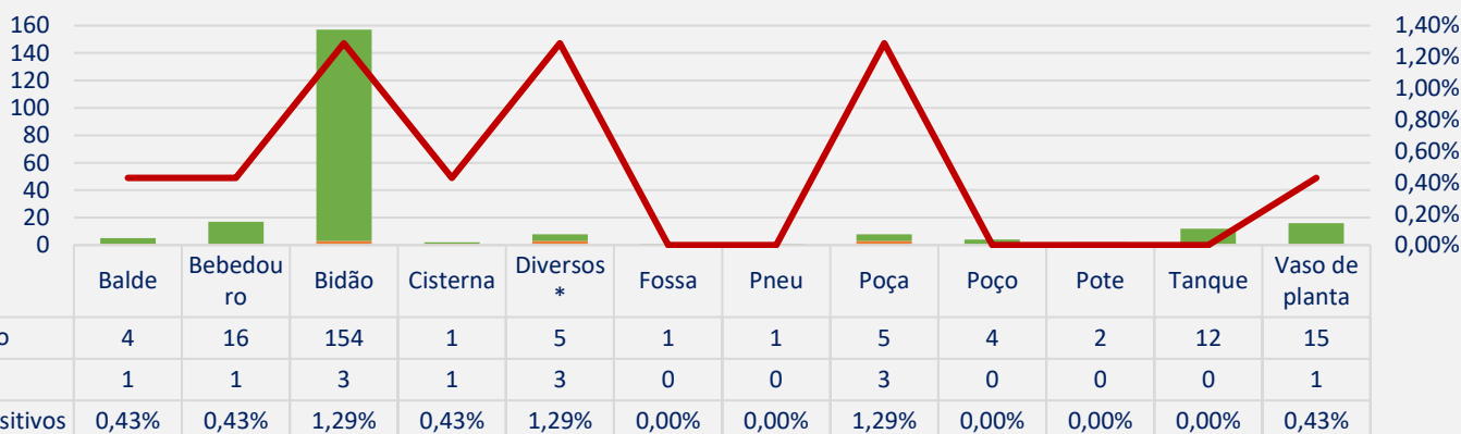
Gráfico 3: Criadouros positivos e negativos, inspecionados