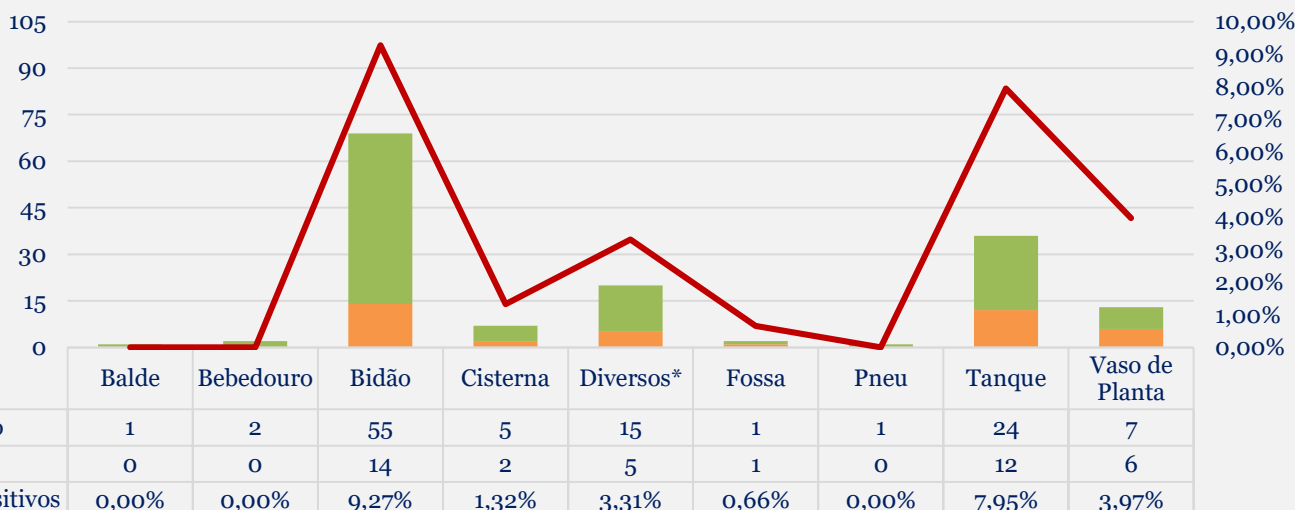
Gráfico 1: Criadouros positivos e negativos, inspecionados.