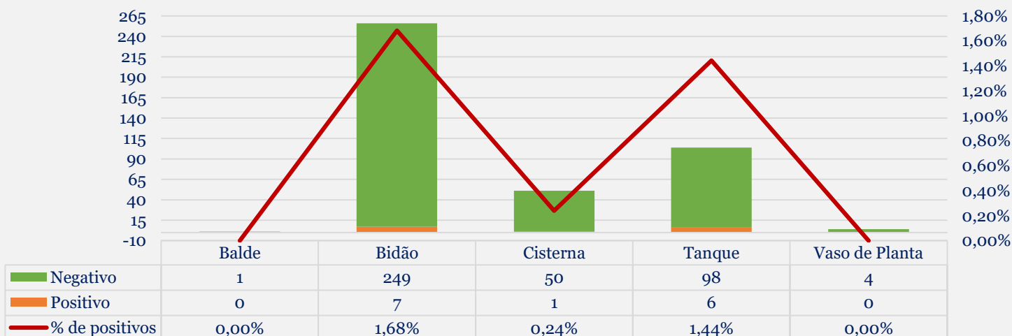
Gráfico 1: Criadouros positivos e negativos, inspecionados.

✓ Durante o levantamento não foi encontrado nenhuma espécie da subfamília Anophelinae .