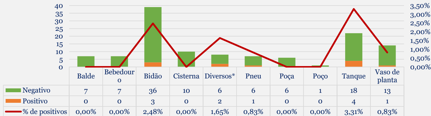
Gráfico 3: Criadouros positivos e negativos, inspecionados